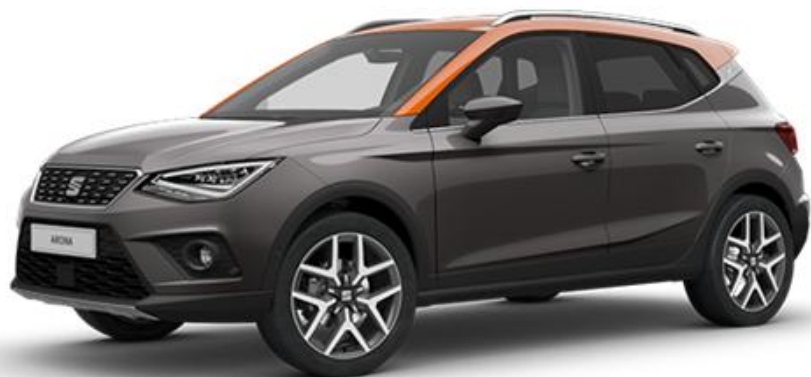
S7S7 - MAGNETIC SIVA REFERENCE STYLE XCELLENCE FR