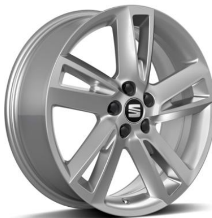
DYNAMIC 17" (FR SERIJA)