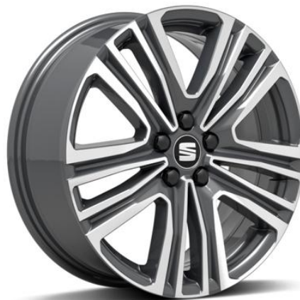
DYNAMIC 17" (XCELLENCE SERIJA)