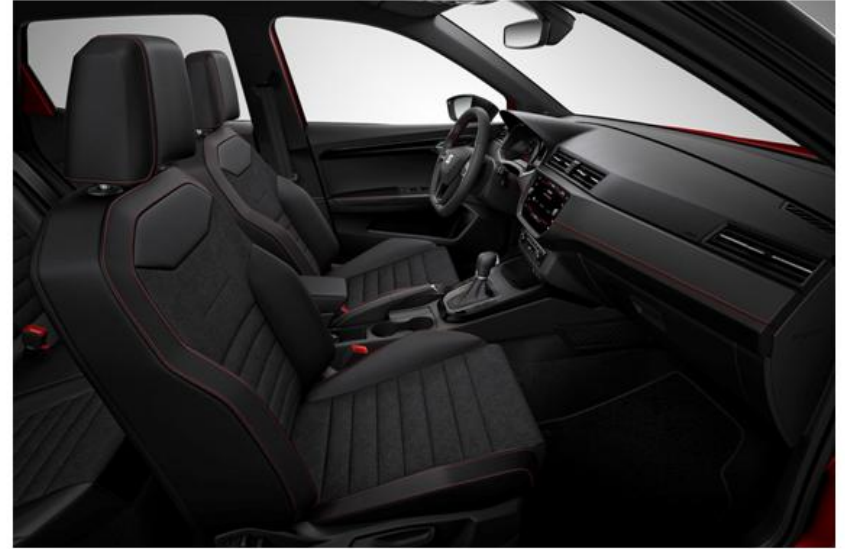
FR - FA + WL7 (OPCIJA)