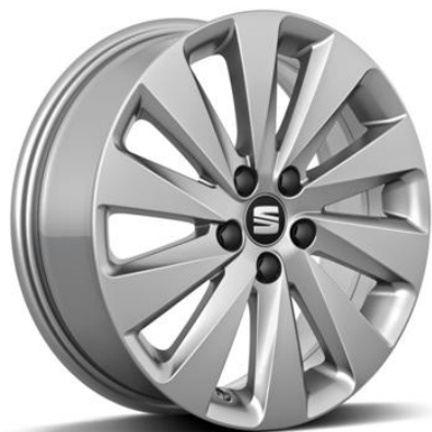
DESIGN 16" (REFERENCE, STYLE SERIJA)