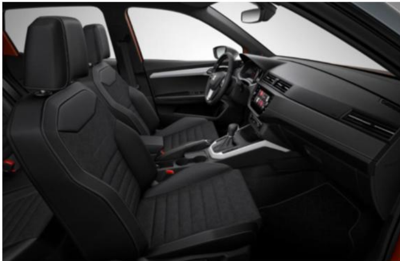
XCELLENCE - CD + WL7 (OPCIJA)