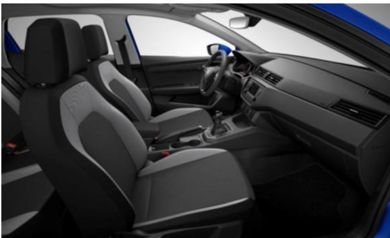
STYLE - CB (SERIJA)