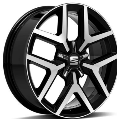
PERFORMANCE 18" (FR OPCIJA)