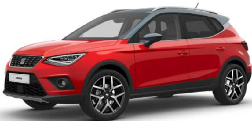
9M9M - CRVENA REFERENCE STYLE XCELLENCE FR