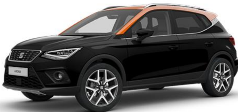
0E0E - MIDNIGHT CRNA REFERENCE STYLE XCELLENCE FR