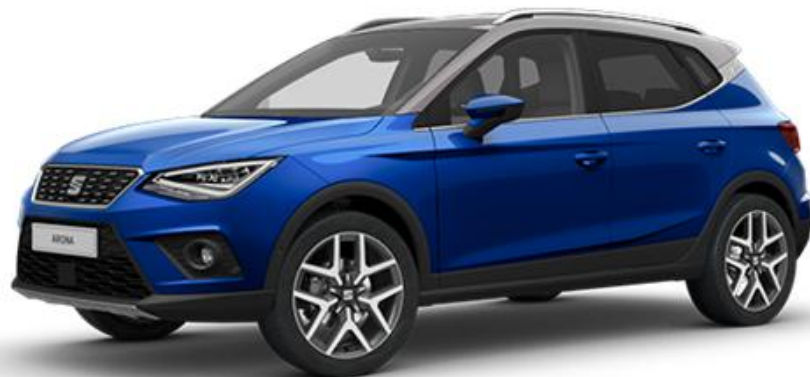
7Y7Y - MYSTERY PLAVA REFERENCE STYLE XCELLENCE FR