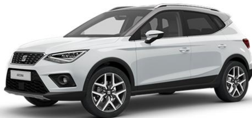
2Y2Y - NEVADA BIJELA REFERENCE STYLE XCELLENCE FR