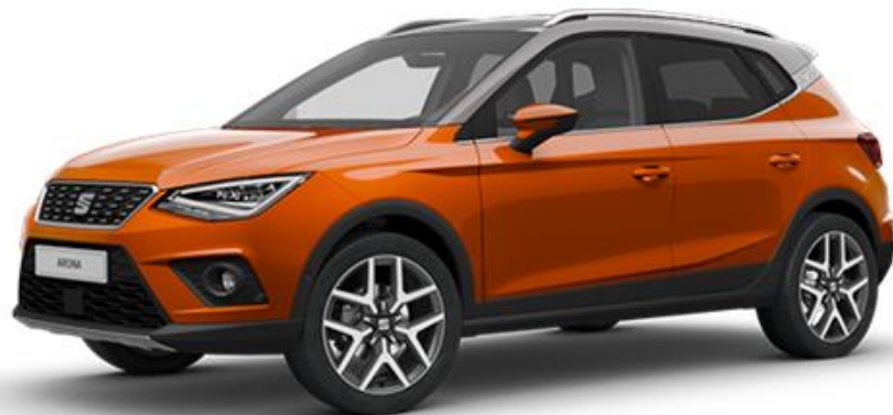
F5F5 - ECLIPSE NARANDŽASTA REFFFRNCF STYI F XCFI I FNCF FR