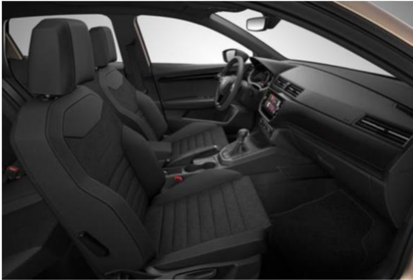
STYLE - CB + WL7 (OPCIJA)