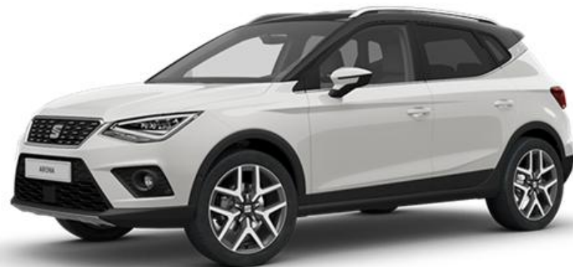
B4B4 - BIJELA REFERENCE STYLE XCELLENCE FR