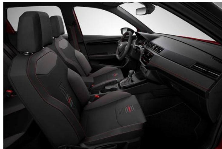
FR - FA (SERIJA)