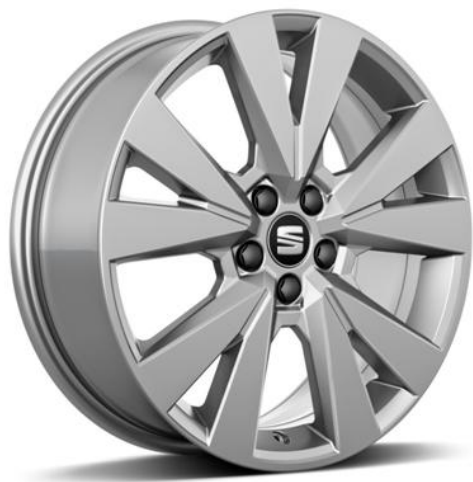
DYNAMIC 17" (STYLE OPCIJA)