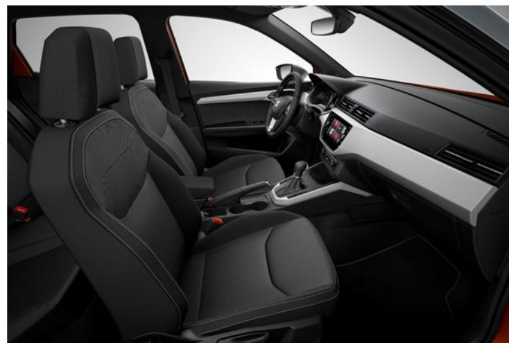
XCELLENCE - CD (SERIJA)