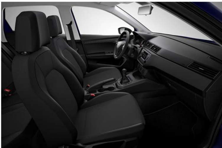
REFERENCE - AF (SERIJA)