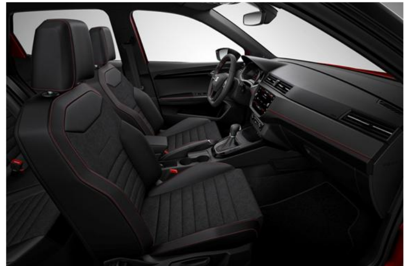
FR - FA + WL7 (OPCIJA)