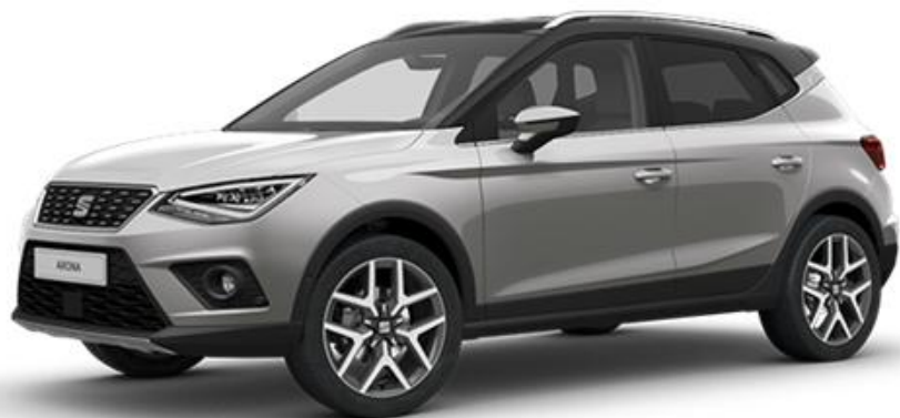
L5L5 - URBAN SIVA REFERENCE STYLE XCELLENCE FR