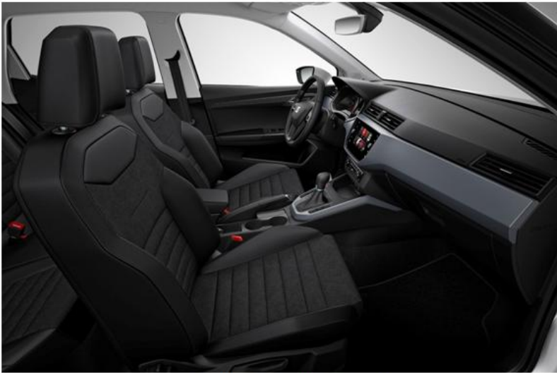
STYLE - CB + WL7 (OPCIJA)