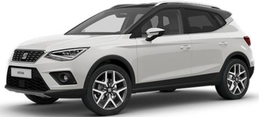
B4B4 - BIJELA REFERENCE STYLE XCELLENCE FR