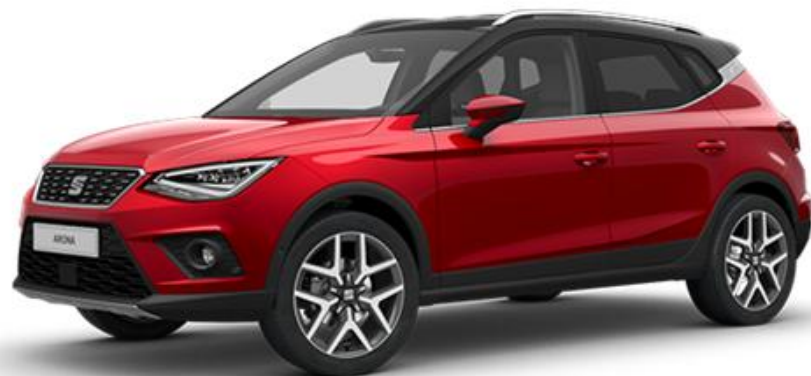
E1E1 - DESIRE CRVENA REFERENCE STYLE XCELLENCE FR