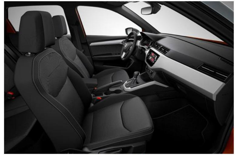
XCELLENCE - CD (SERIJA)