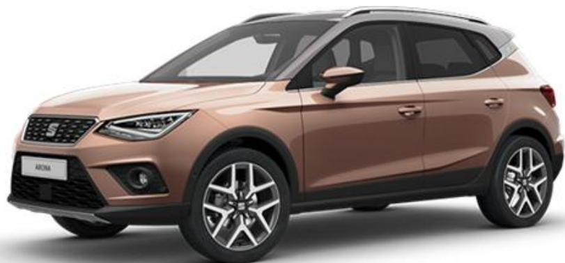
F8F8 - MYSTIC MAGNETA REFERENCE STYLE XCELLENCE