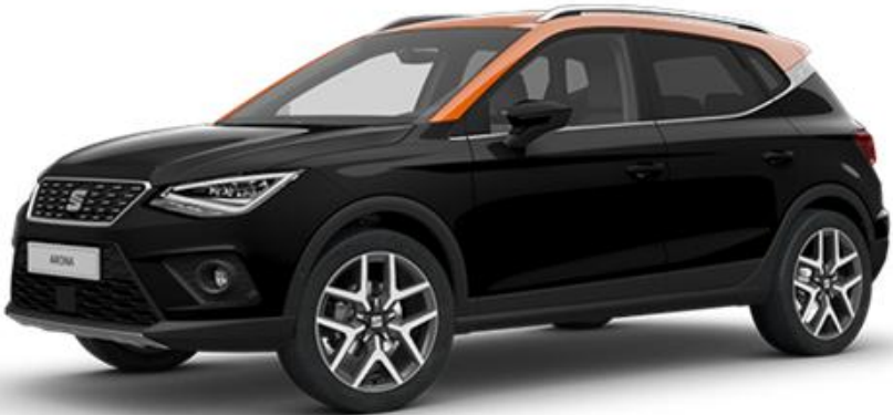
0E0E - MIDNIGHT CRNA REFERENCE STYLE XCELLENCE FR