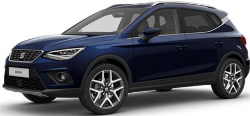
9550 - MEDITERRANEO PLAVA REFERENCE STYLE XCELLENCE FR