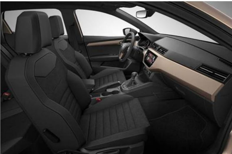
XCELLENCE - CD + WL7 (OPCIJA)