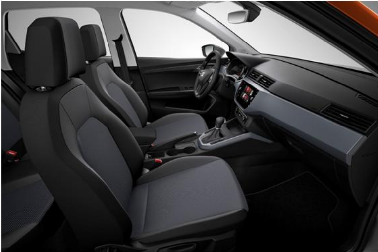
STYLE - CB (SERIJA)