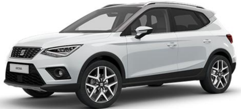
2Y2Y - NEVADA BIJELA REFERENCE STYLE XCELLENCE FR